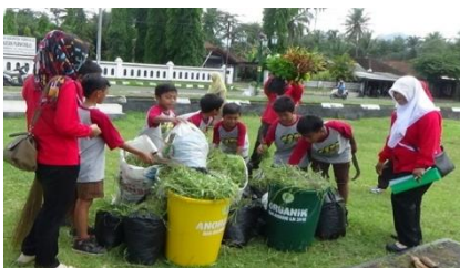
Gambar 5. Kerja Bhakti di lapangan kecamatan Purworejo

Kegiatan lingkungan berbasis partisipatif yang dilaksanakan di SDN Brenggong dilaksanakan sesuai standar sekolah Adiwiyata yang termuat dalam buku panduan Adiwiyata. Pelaksanaan kegiatan berbasis lingkungan di SDN Brenggong dilaksanakan melalui piket kelas, jum'at bersih setiap 2 minggu sekali, dan kegiatan pembiasaan diri yang dilaksanakan setiap hari sabtu. Pemanfaatan lahan dan fasilitas mengenai lingkungan hidup juga tersedia seperti pembuatan green house , kolam, gazebo, dan taman kelas. Dalam upaya perlindungan dan pengelolaan lingkungan hidup, warga sekolah melakukan inovasi dan kreasi melalui pembuatan pupuk kompos, pengelolaan sanitasi, publikasi hasta karya, publikasi karya ilmiah. Pelaksanaan kegiatan lingkungan berbasis partisipatif juga melibatkan instansi dari luar seperti Dinas Lingkungan Hidup Kabupaten Purworejo, Puskesmas Cangkep Kabupaten Purworejo, Kepolisian Sektor Purworejo, Desa Brenggong, SDN Kliwonan, SDN 2 Borokulon, SDN Keduren, Pengusaha Bibit Ikan Kecamatan Loano Kabupaten Purworejo, Pengusaha Pembibitan Tanaman Kecamatan Loano Kabupaten Purworejo, Dinas Kehutanan dan Perkebunan Kabupaten Purworejo.