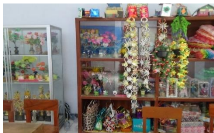
Gambar 6. Hasil karya nyata siswa disimpan di Etalase