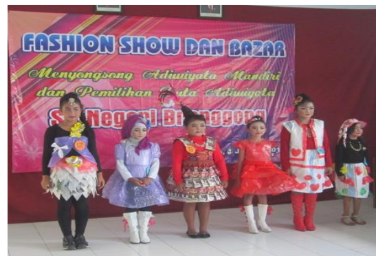
Gambar 4 Siswa SDN Brenggong memakai pakaian dari bahan bekas yang menawan pada acara fashion show dan bazar