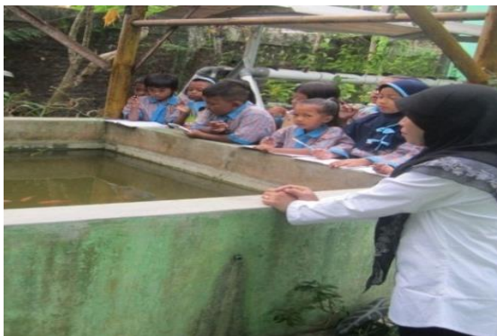
Gambar 3. Guru sedang mengajarkan operasi perhitungan dengan media kolam ikan