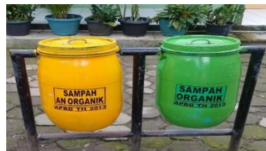
Gambar 7. Tempat sampah dengan jenis terpisah

Kantin sekolah sudah tidak menjual makanan yang berbahan 5P (penyedap rasa, pewarna buatan, pemanis, pengawet dan pengental) yang tidak sesuai standar kesehatan dan sudah tidak menggunakan bungkus makanan dari plastik. Makanan yang dijual dibungkus dengan daun dan jenis makanan yang tidak dibungkus maka disajikan dengan tempat tertutup dan jika siswa membeli menggunakan boks makanan yang sudah dibawa masing-masing. Keadaan di sekitar kantin sudah menunjukkan kantin yang sehat serta lingkungan yang bersih, tempat sampah dan tempat cuci tangan tersedia di kantin. Hanya saja belum ada media pendukung seperti poster adab makan dan doa sebelum dan sesudah makan.