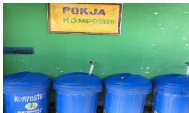
Gambar 8. Komposter di halam belakang SDN Brenggong