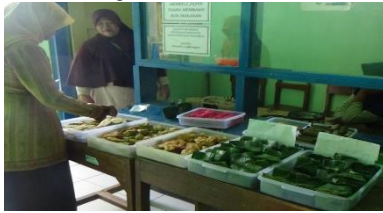
Gambar 10. Guru sedang memeriksa makanan yang dijual di kantin