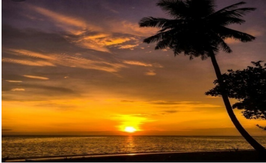
Gambar 1 Objek Wisata Pantai Mapaddegat

Pantai Mapaddegat adalah objek wisata yang memiliki hamparan pantai nan cantik. Pantai Mapaddegat menjadi magnet wisata yang tak pernah sepi di kunjungi. Pantai mapaddegat yang beralamat Jln. Raya Mapaddegat Km 4, Tuapeijat Sipora Utara Kabupaten Kepulauan Mentawai. Di kawasan Pantai Mapaddegat ini pengunjung juga tidak hanya disuguhi dengan keindahan pantai yang memukau namun juga panorama bawah laut yang mempesona.